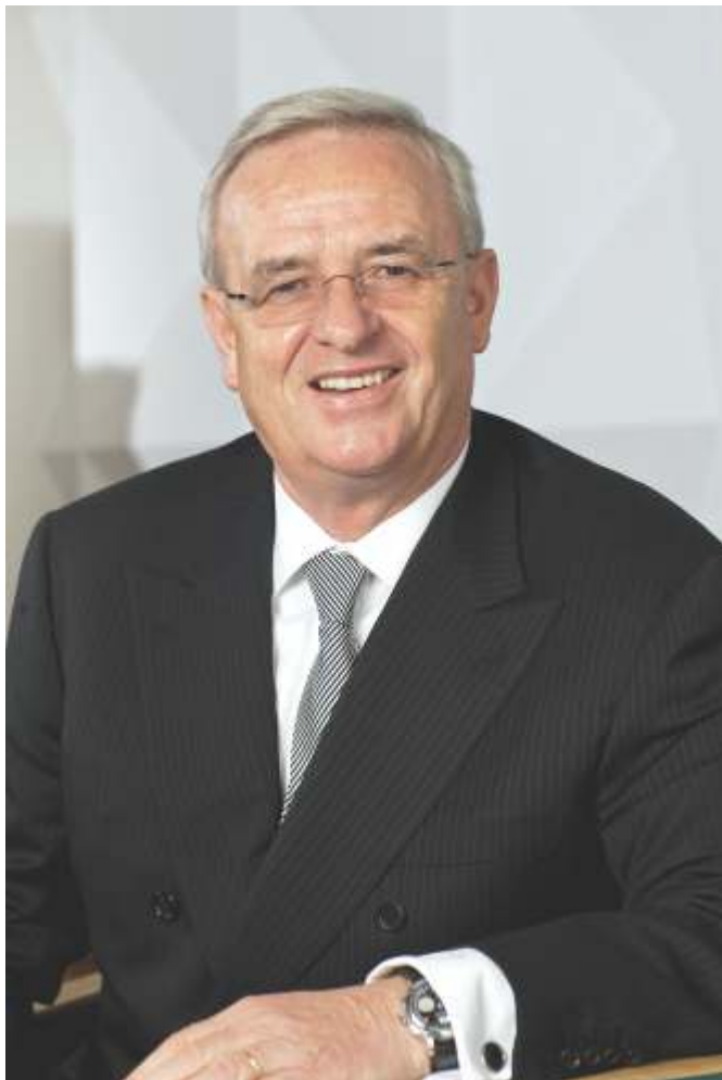
Prof. Dr. Martin WINTERKORN. Kryetar i Bordit Drejtues të Volkswagen AG Chairman of the Board of Management of Volkswagen AG

“Në vitin 2013 Volkswagen Group shpenzoi më shumë se dhjetë miliardë euro për kërkim dhe zhvillim. Në këtë mënyrë garantojmë pozicionin tonë si lider në teknologji.”